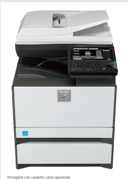
Immagine con cassetto carta opzionale.

CONNETTITI AL CLOUD CON I MODULI OPZIONALI SHARP OSA