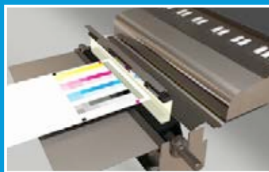
FWA (Full Width Array)

La funzione Allineamento automatizzato dell'immagine al supporto assicura un allineamento delle immagini e un registro da fronte a retro perfetti indipendentemente dal tipo o formato del supporto, facendovi risparmiare tempo ed eliminando onerosi sprechi dovuti a un registro scadente o alla distorsione dell'immagine.